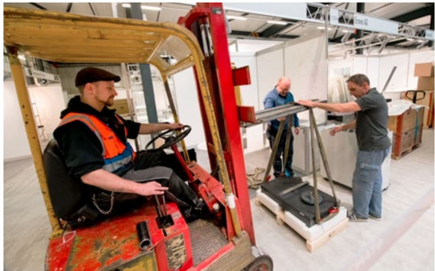
Setting up SIAMS / Montage SIAMS