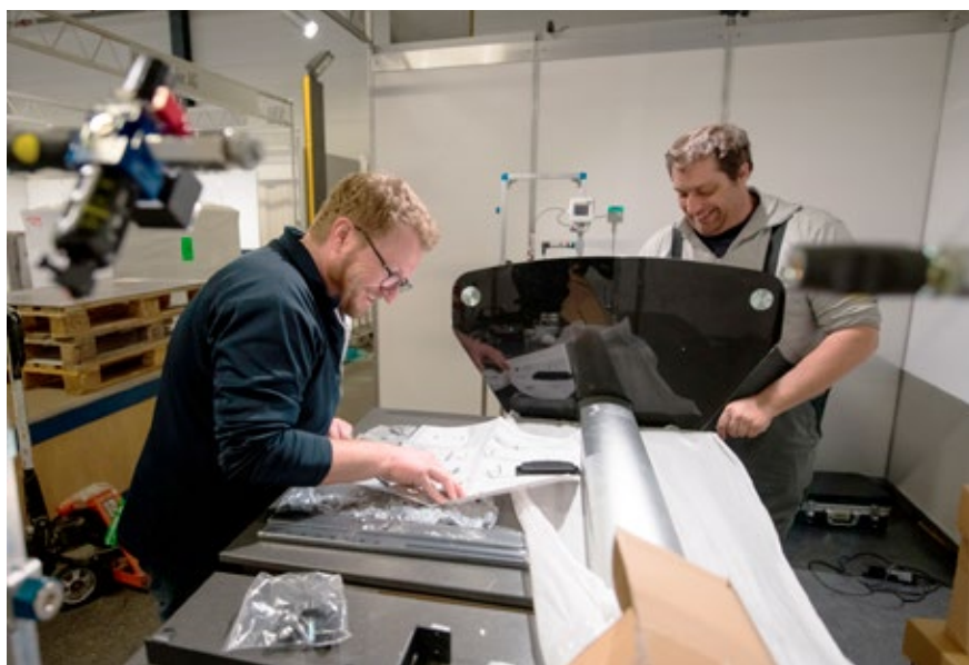
Montage du SIAMS / Setting up SIAMS

En 2018, la seizième édition du SIAMS a réuni 450 exposants et quelque 14'000 visiteurs y ont participé. L'édition de 2020, qui aura lieu du 10 au 13 novembre, affiche complet depuis une année au niveau des espaces loués. ◦