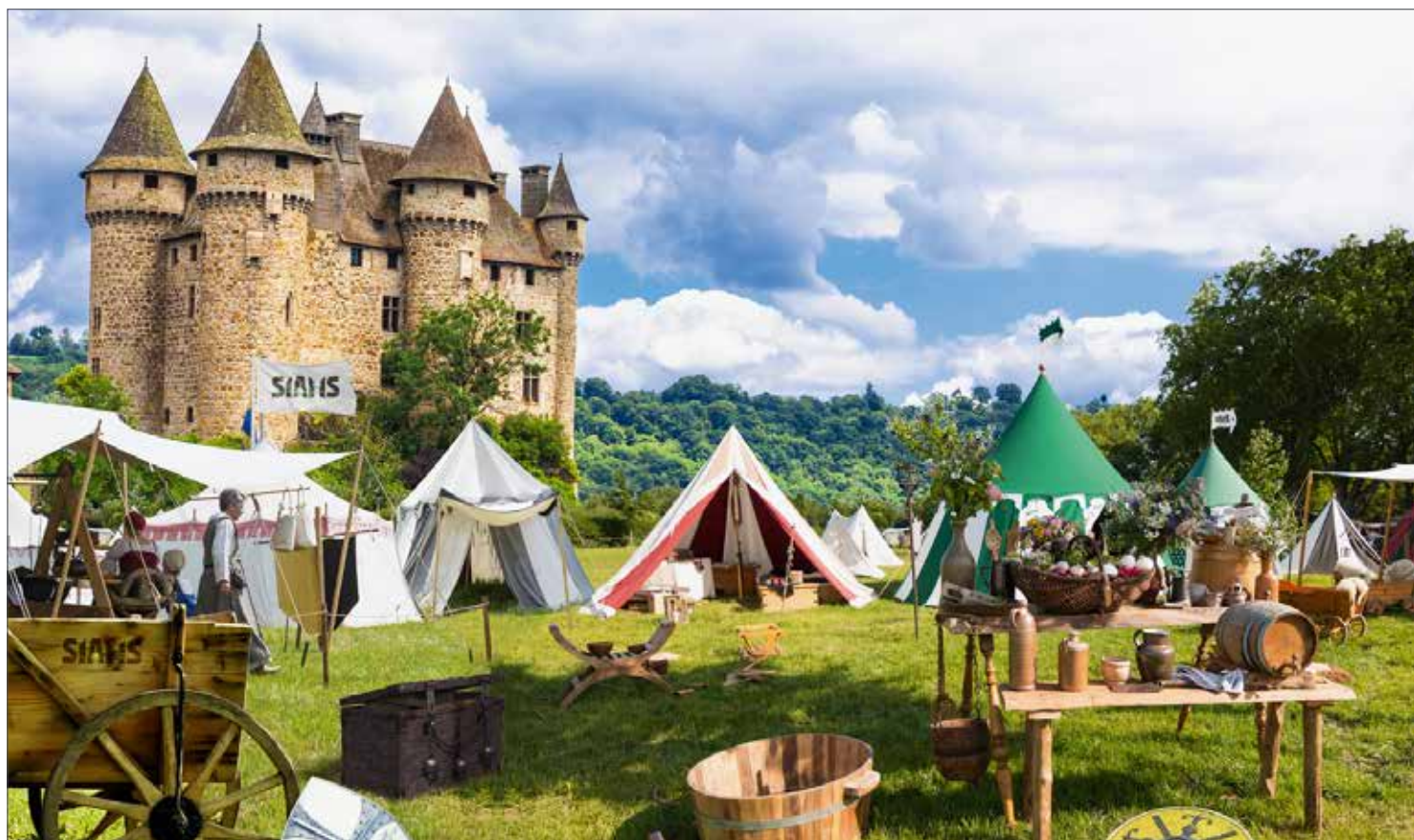
L'exposition est probablement le plus vieux média utilisé pour promouvoir largement des produits et des services et il doit se réinventer en permanence. A l'image, le SIAMS 999 à la veille de son ouverture (image réalisée avec trucage).

De nombreuses petites entreprises offrant des solutions à la pointe de la technique n'exposent qu'au SIAMS. Nous offrons aux visiteurs et aux exposants un panorama complet des compétences et solutions qui se sont développées dans notre région et plus largement sur la planète microtechnique. Et si ces solutions sont valables loin à la ronde, elles le sont également pour les entreprises de la place qui découvrent bien souvent qu'elles sont allées chercher bien loin des compétences et des produits qui existent sur place.