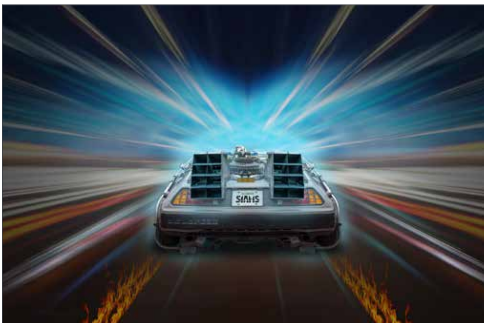
Voyage dans le temps pour parler du passé, du présent et du futur des expositions.

Le monde des expositions en Suisse (et à l'international) est en évolution permanente. Les annonces déstabilisant ce marché que l'on croyait immuable se succèdent. Chaque évolution est source de remise en question et d'innovation, c'est pourquoi nous continuons de croire que le « modèle exposition » comme nous l'appliquons a encore un bel avenir devant lui.